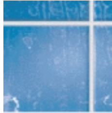
...y con manchas al Secarse.