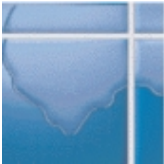
El agua discurre como una fina película en la superficie ...