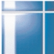
...pudiendo limpiarse muy fácilmente con el resultado de una superficie limpia